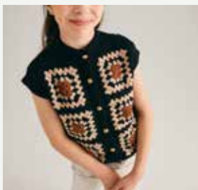
10b. Le gilet Christine PHIL PARTNER 3.5, PHIL STARLIGHT - P.21 Technique utilisée : Tricot & Crochet