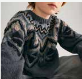
13a. Le pull Charlie PHIL PARTNER 3,5 - P.23 Technique utilisée : Tricot