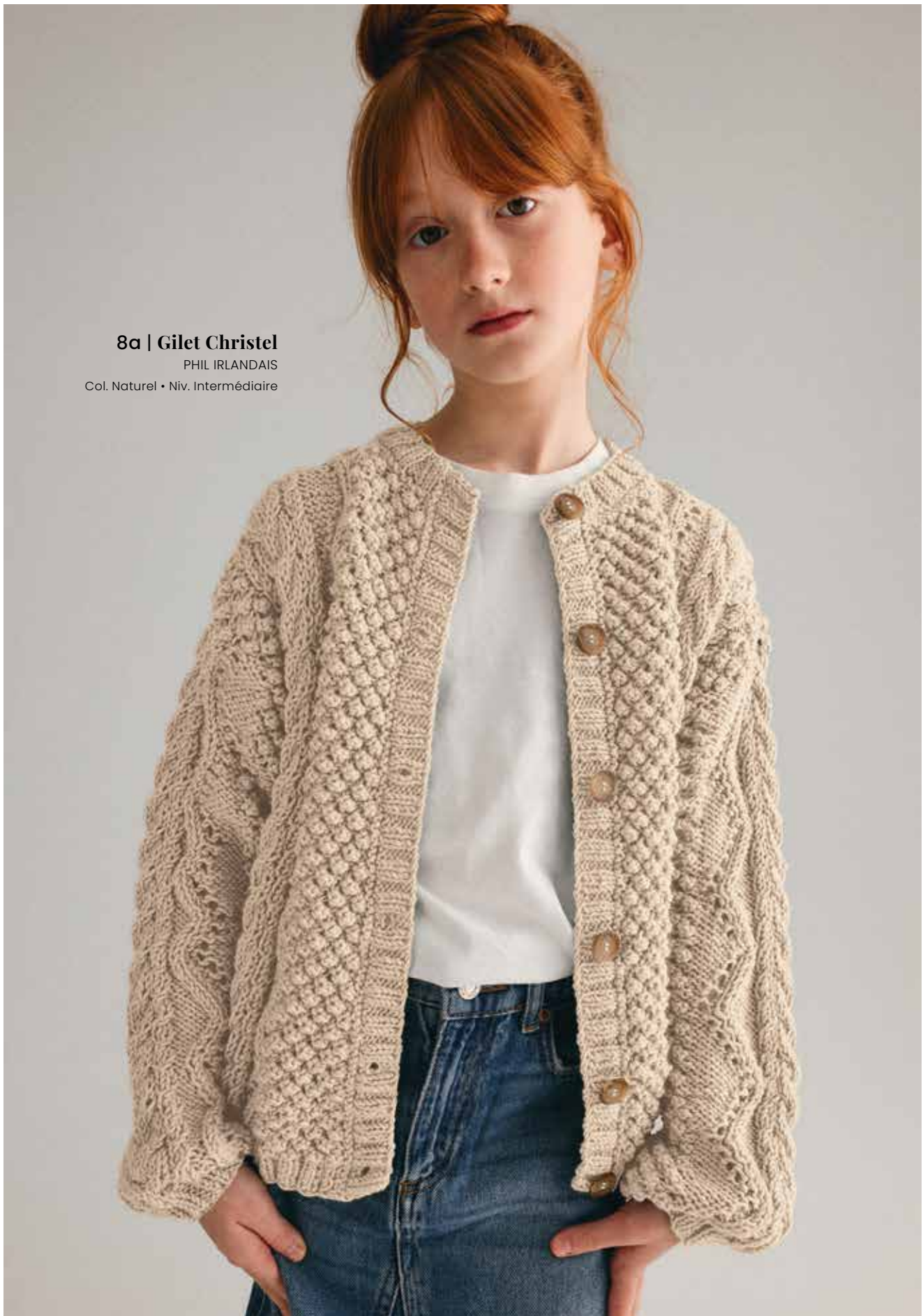
8a | Gilet Christel PHIL IRLANDAIS Col. Naturel • Niv. Intermédiaire