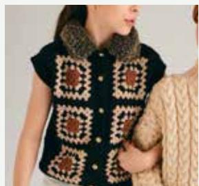
10a. Le gilet Christine PHIL PARTNER 3.5, PHIL STARLIGHT, PHIL INUIT - P.21 Technique utilisée : Tricot & Crochet