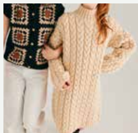
11a. La robe Chelby PHIL CHARLY - P.20 Technique utilisée : Tricot