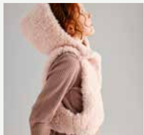
4. Le plastron Chloé PHIL INUIT - P.8 Technique utilisée : Tricot