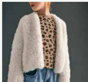
1a. Le veste Cathy PHIL INUIT - P.6 Technique utilisée : Tricot

Niveau Facile : Explications adaptées au niveau débutant.