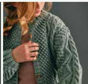
8b. Le gilet Christel PHIL IRLANDAIS - P.34 Technique utilisée : Tricot