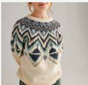
13b. Le pull Charlie PHIL PARTNER 3,5, PHIL STARLIGHT - P.30 Technique utilisée : Tricot