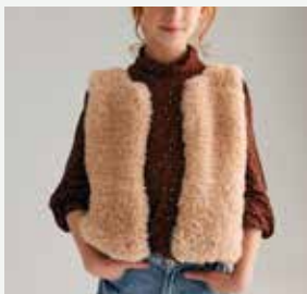
14b. Le gilet Cléa PHIL INUIT - P.45 Technique utilisée : Tricot