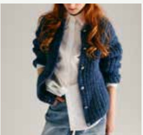
16. Le gilet Céleste PHIL BIJOU - P.27 Technique utilisée : Tricot