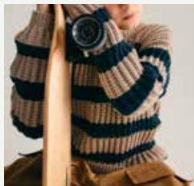
15. Le pull Claude PHIL PARTNER 3,5 - P.26 Technique utilisée : Tricot