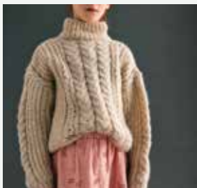
6a. Le pull Coralie PHIL BIJOU - P.15 Technique utilisée : Tricot