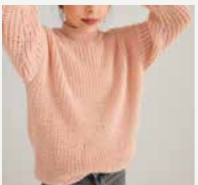
18a. Le pull Céline PHIL CARESSE - P.38 Technique utilisée : Tricot

VOUS SOUHAITEZ DÉBUTER AU TRICOT / CROCHET ?