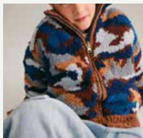
19. Le blouson réversible Cyril PHIL RANDONNÉES, PHIL DOUCE - P.47 Technique utilisée : Tricot

POUR CONNAÎTRE VOTRE NIVEAU, REPORTEZ-VOUS À NOTRE GRILLE EN FIN DE CATALOGUE.