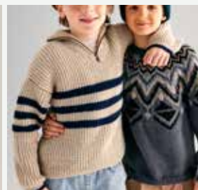
12a. La pull Charles PHIL PARTNER 3.5 - P.22 Technique utilisée : Tricot