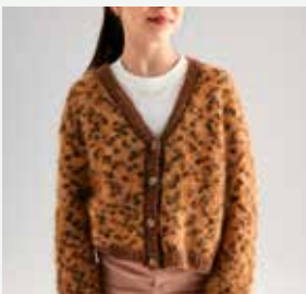
2a. Le gilet Carmen PHIL LÉO, PHIL CHIC LUREX - P.7 Technique utilisée : Tricot