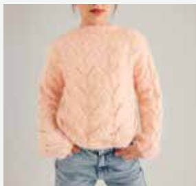
9a. Le pull Carole PHIL BEAUGCENCY - P.39 Technique utilisée : Tricot