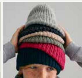
17. Les bonnets Casey PHIL PARTNER 3,5 - P.37 Technique utilisée : Tricot