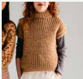
3a. Le pull Clara PHIL LOOPING, PHIL LIGHT MOHAIR - P.7 Technique utilisée : Tricot