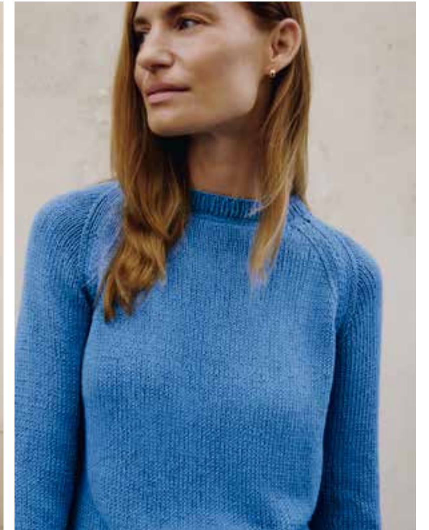
06 – The Tube | 07 – Dodici