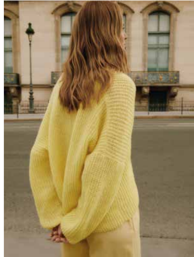
23 – Cara + Bella | 24 – Puno Luce