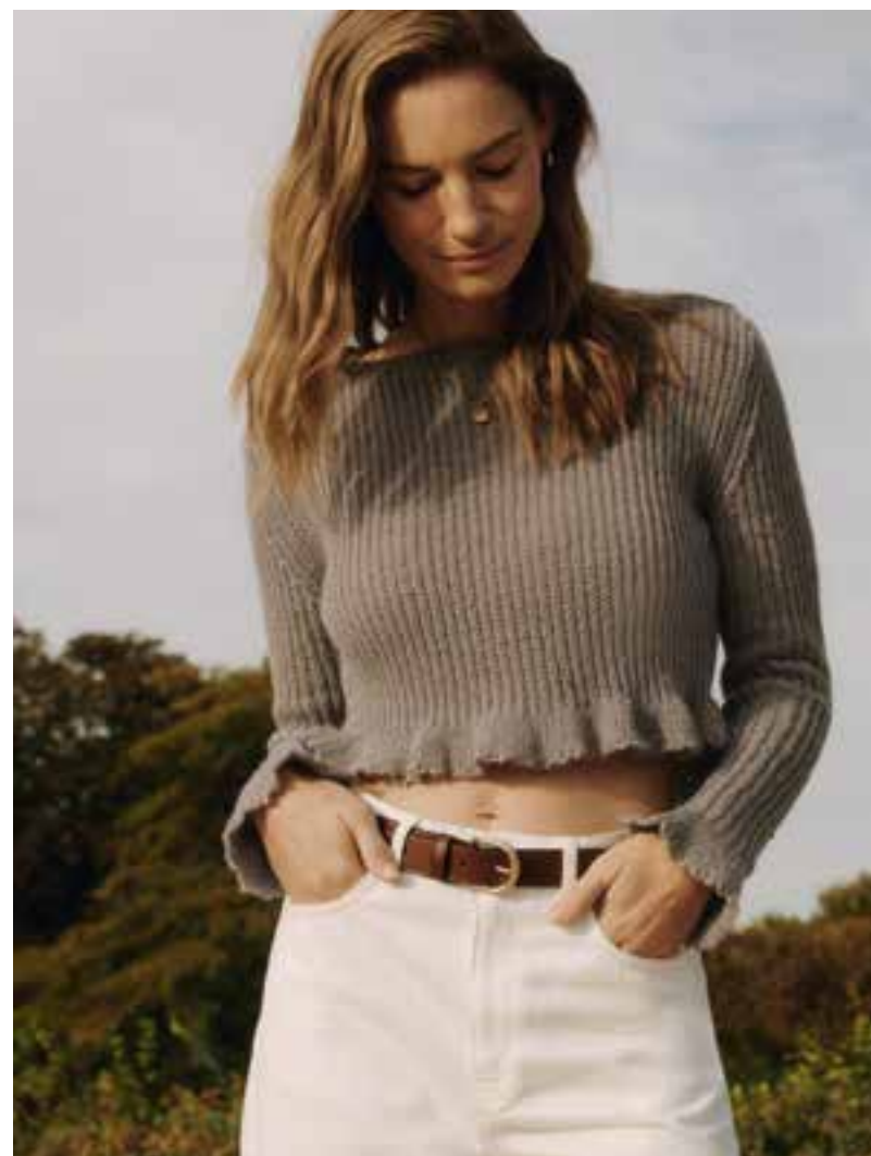
21 | 22 – Puno Luce