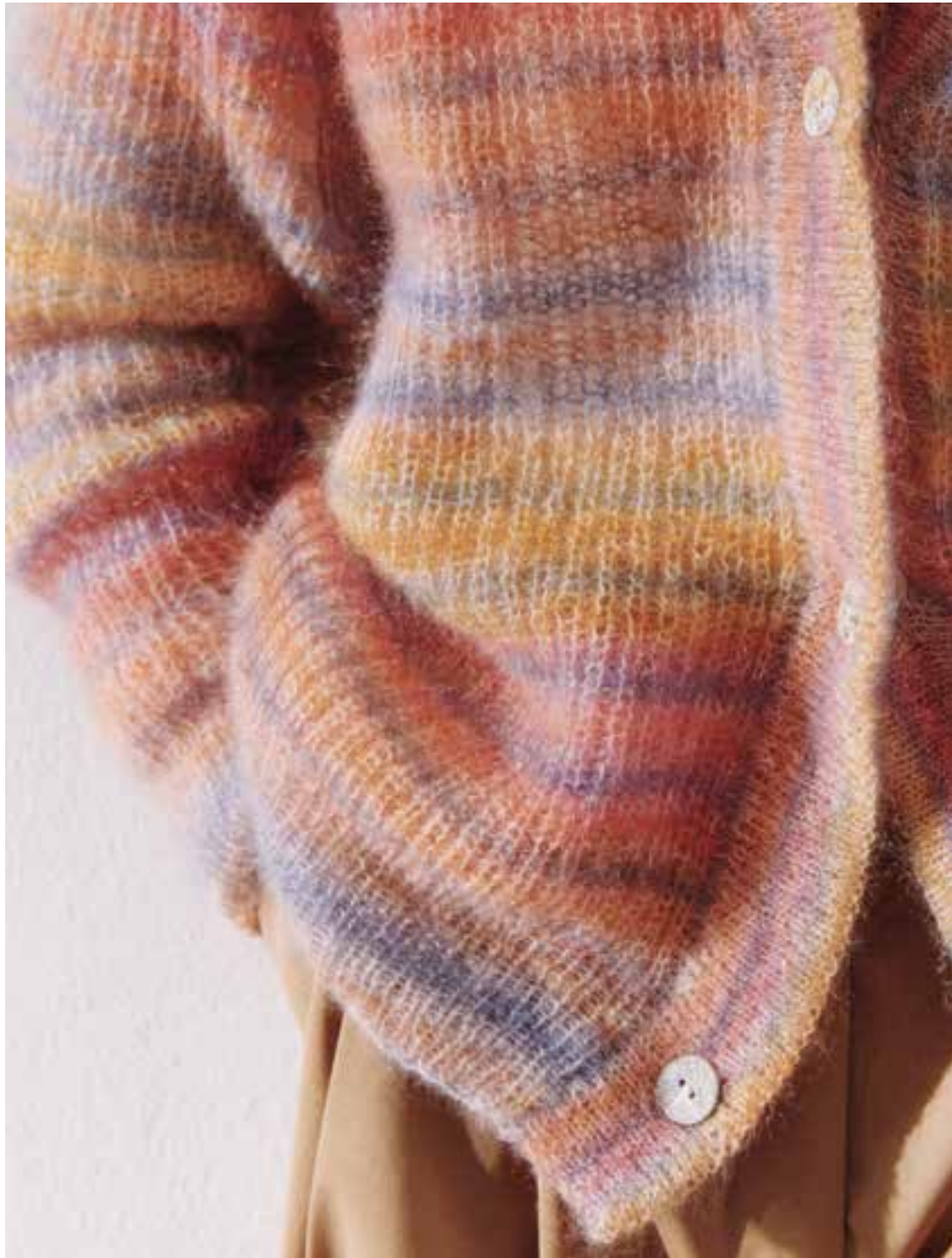
13 – Silkhair Print