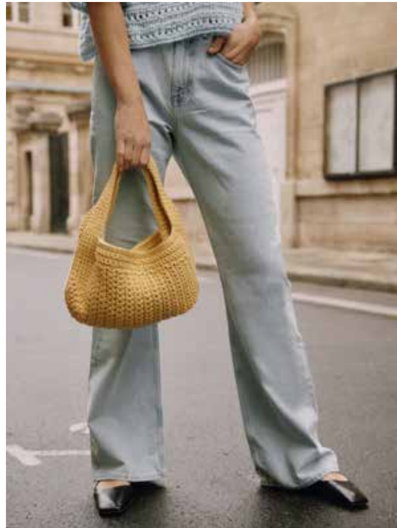
05 – Bella | 06 – The Tube