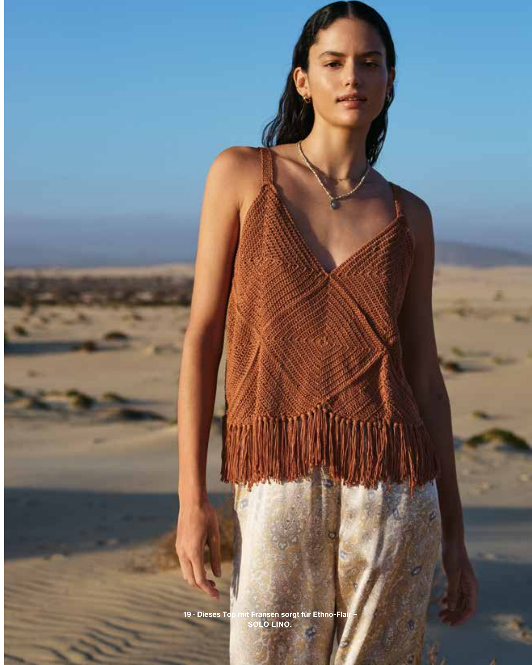
19 · Dieses Top mit Fransen sorgt für Ethno-Flair – SOLO LINO.