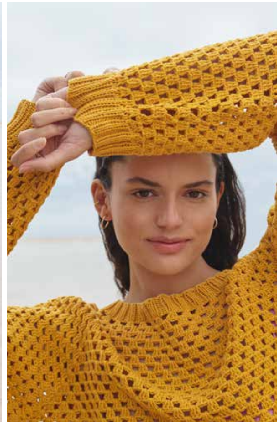
29 · Raglan-Pullover mit Stäbchen-Lochmuster aus LANDLUST BAUMWOLLE .