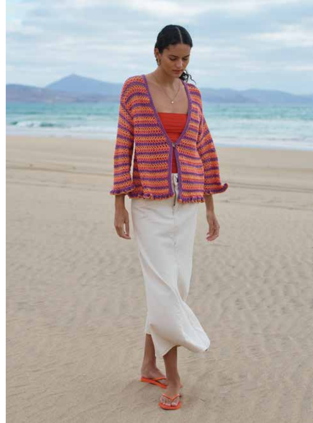
33 · Cardigan im Victory-Muster aus ALTA MODA COTOLANA. Der Clou – der Rüschenabschluss wird ebenfalls gehäkelt.