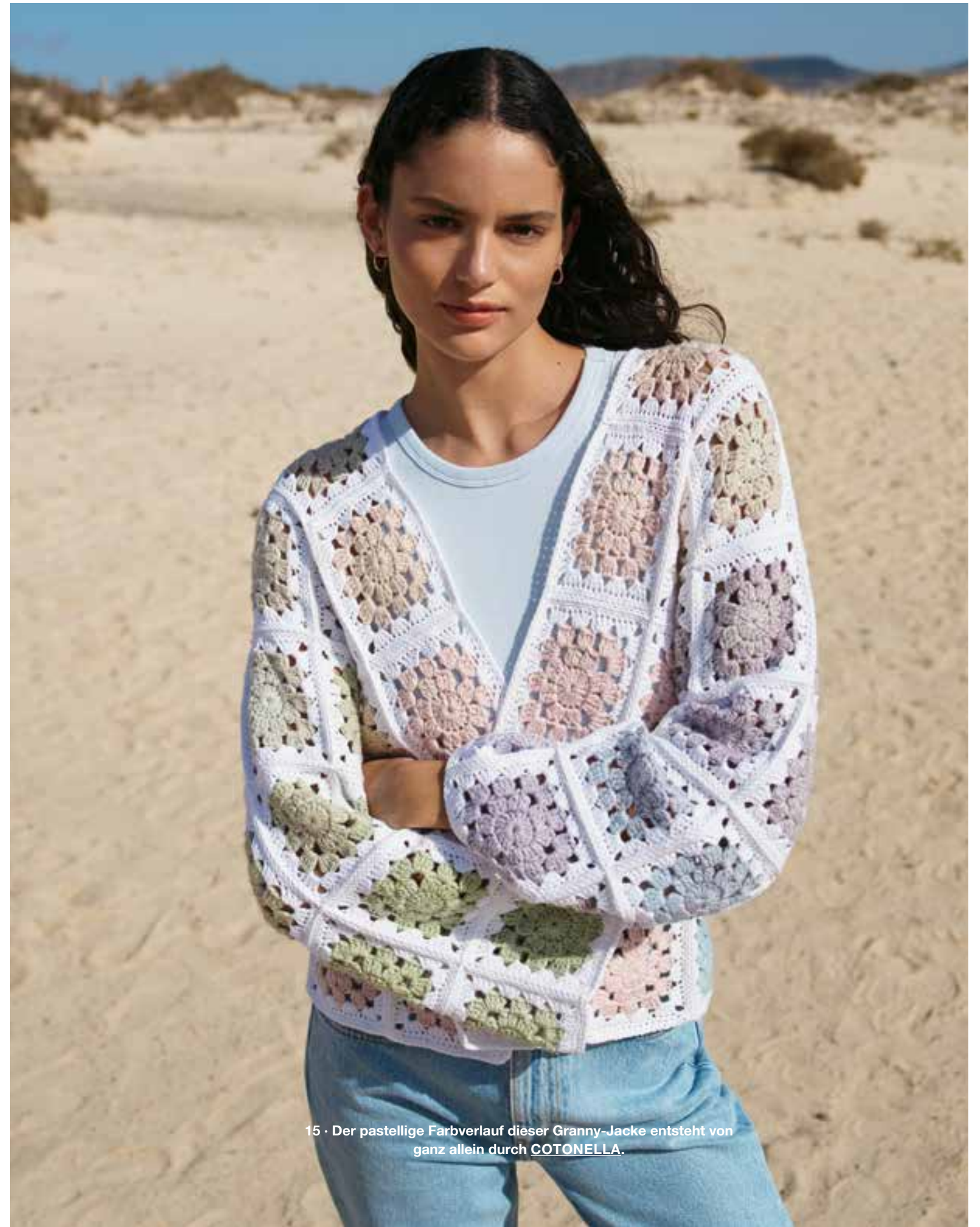
15 · Der pastellige Farbverlauf dieser Granny-Jacke entsteht von ganz allein durch COTONELLA .