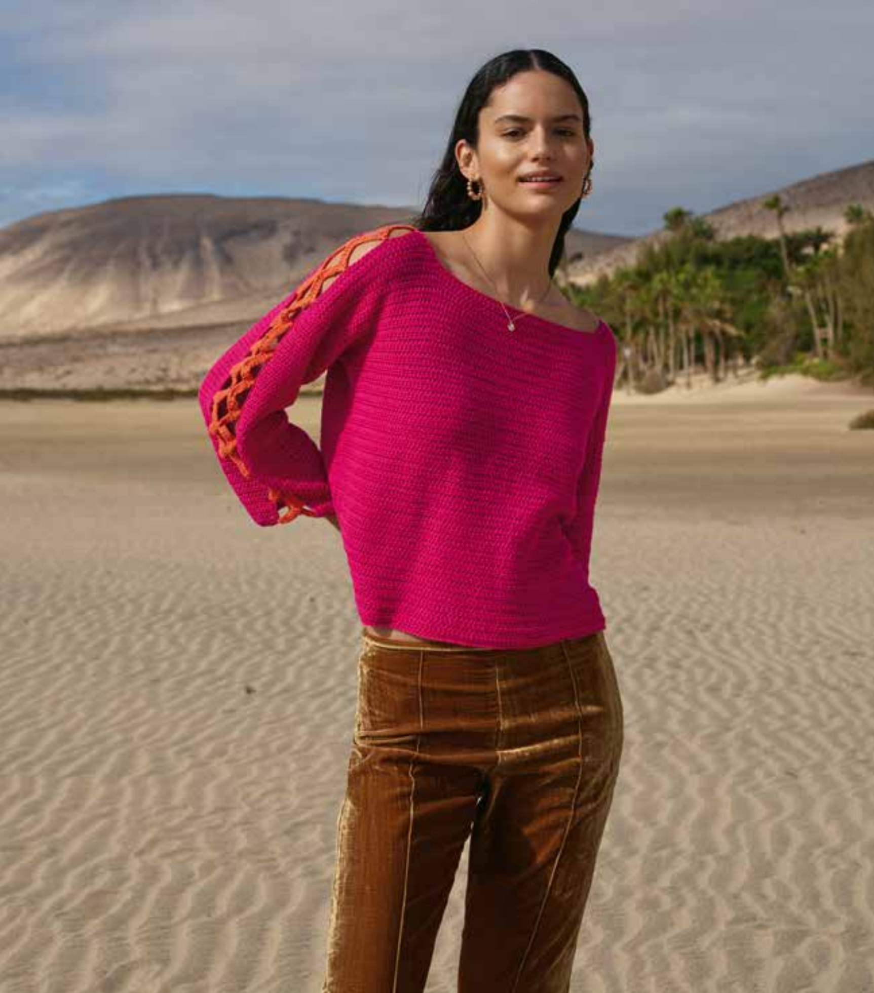
32 · Kurzpulli aus halben Stäbchen mit Zackennaht an den Ärmeln – ELASTICO.