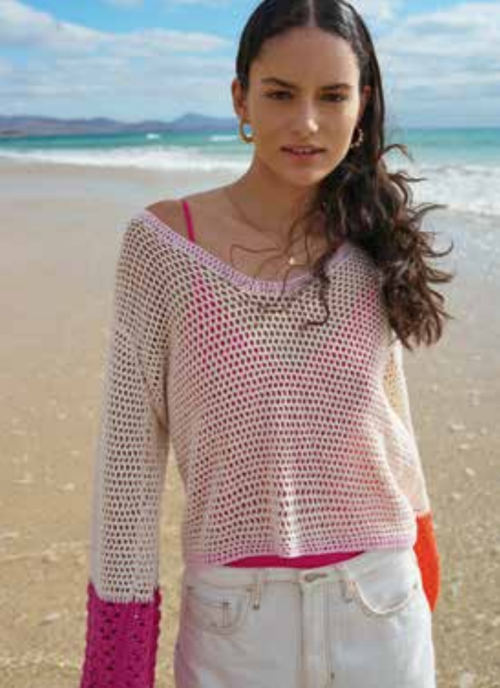
27 · Lockerers Longsleeve im Mustermix mit Color-Blocking-Details und Rückenausschnitt – CAMPO .