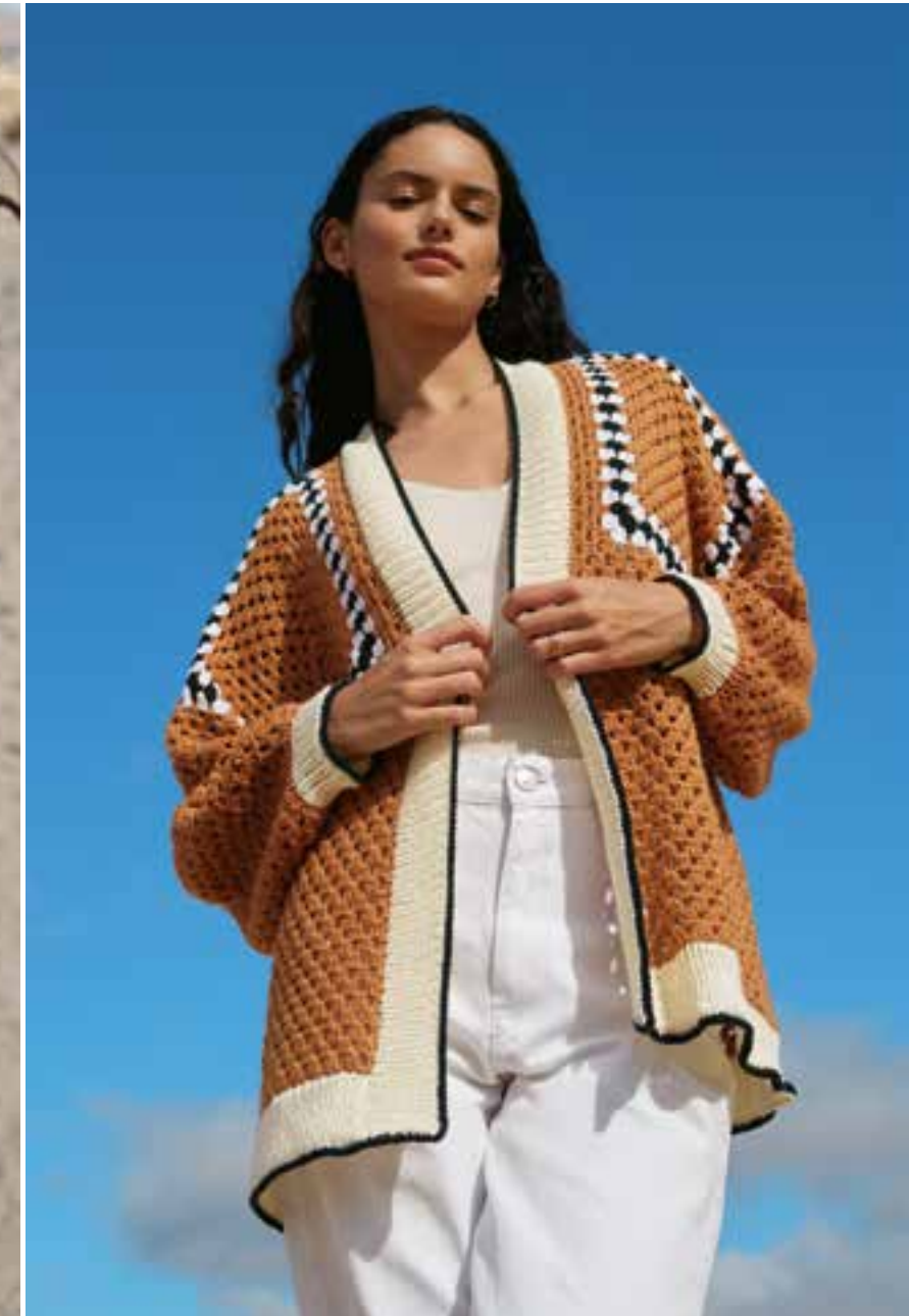
11 · Granny-Technik im marokkanischen Stil und gestrickte Bündchen machen diesen gemütlichen Cardigan zum Highlight – SOFT COTTON.