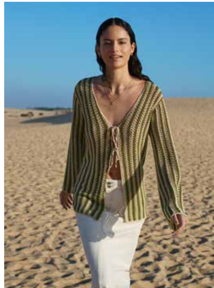
18 · Quergehäkelt und figurschmeichelnd ist die zarte Jacke aus SOLO LINO.