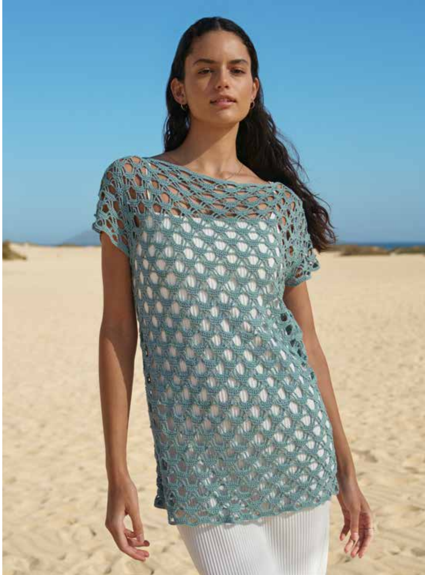
10 · Filigranes Lochmuster-Shirt mit Cap Sleeves – SOLO LINO.