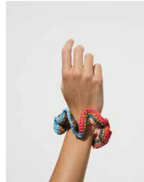
23. SCRUNCHIE - COTONE Garnreste verarbeitet Pauluschkaa gerne in bunten Scrunchies.