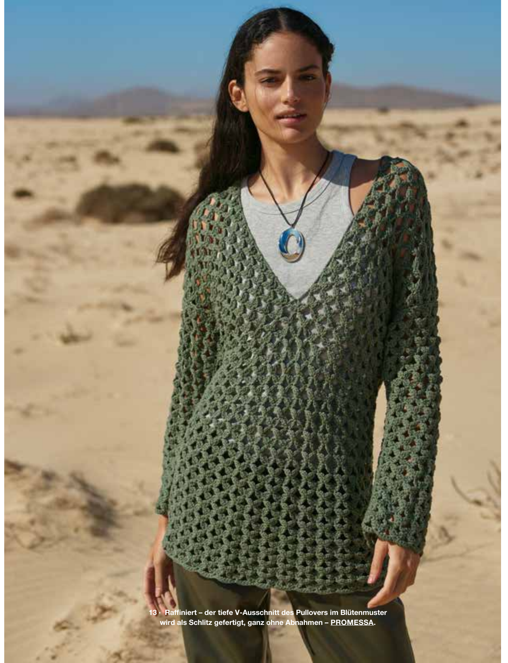
13 · Raffiniert – der tiefe V-Ausschnitt des Pullovers im Blütenmuster wird als Schlitz gefertigt, ganz ohne Abnahmen – PROMESSA .