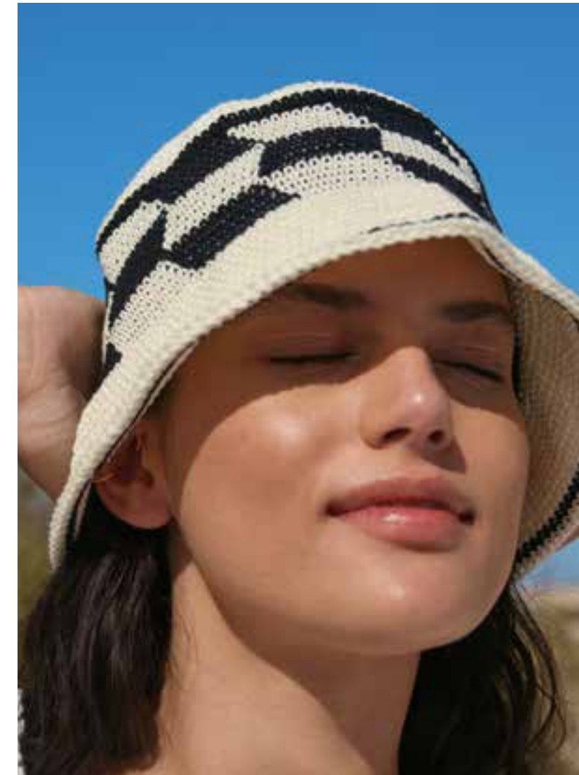
9 · Fischerhut mit grafischem Jacquard-Muster aus COTONE .