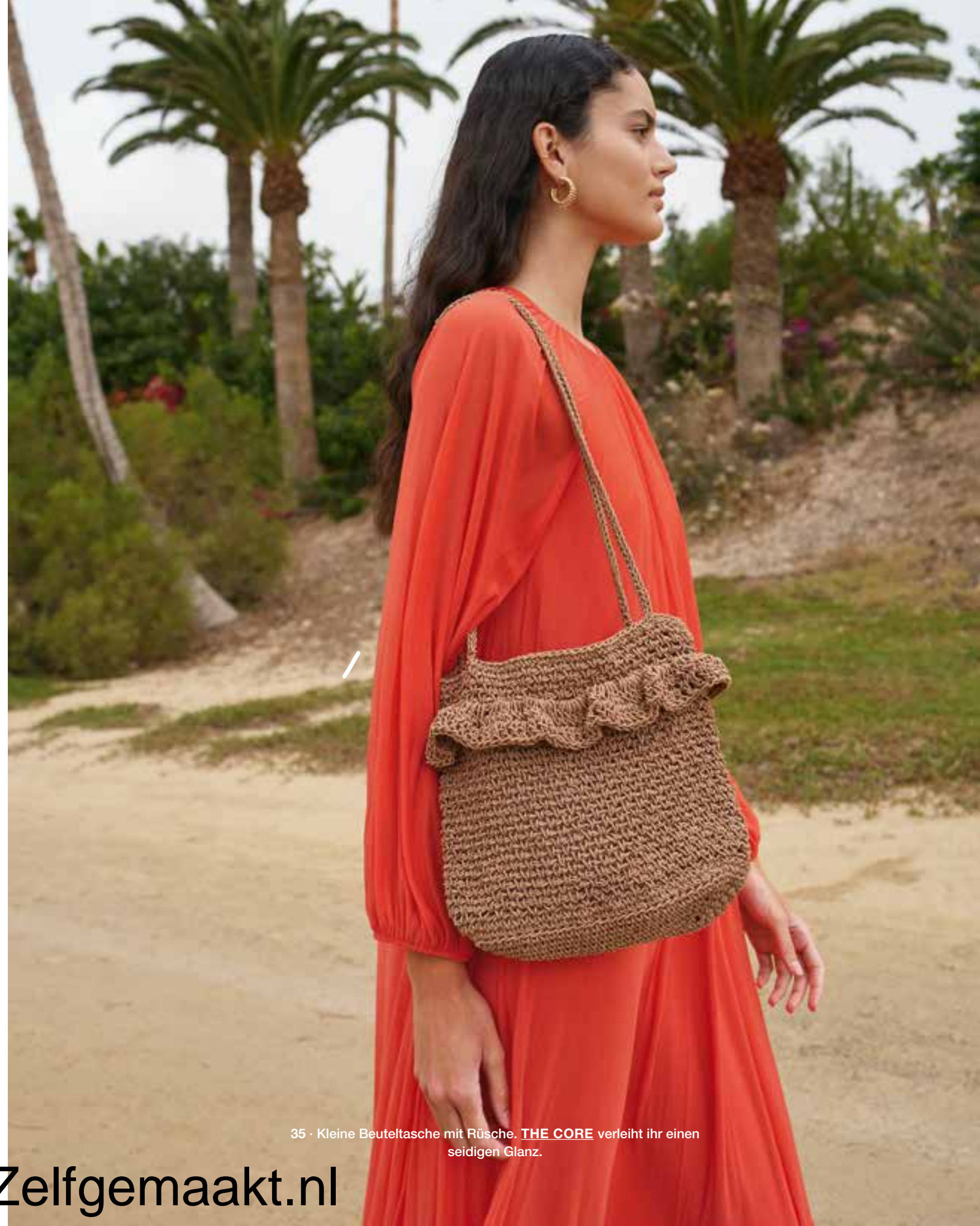
35 · Kleine Beuteltasche mit Rüsche. THE CORE verleiht ihr einen seidigen Glanz.