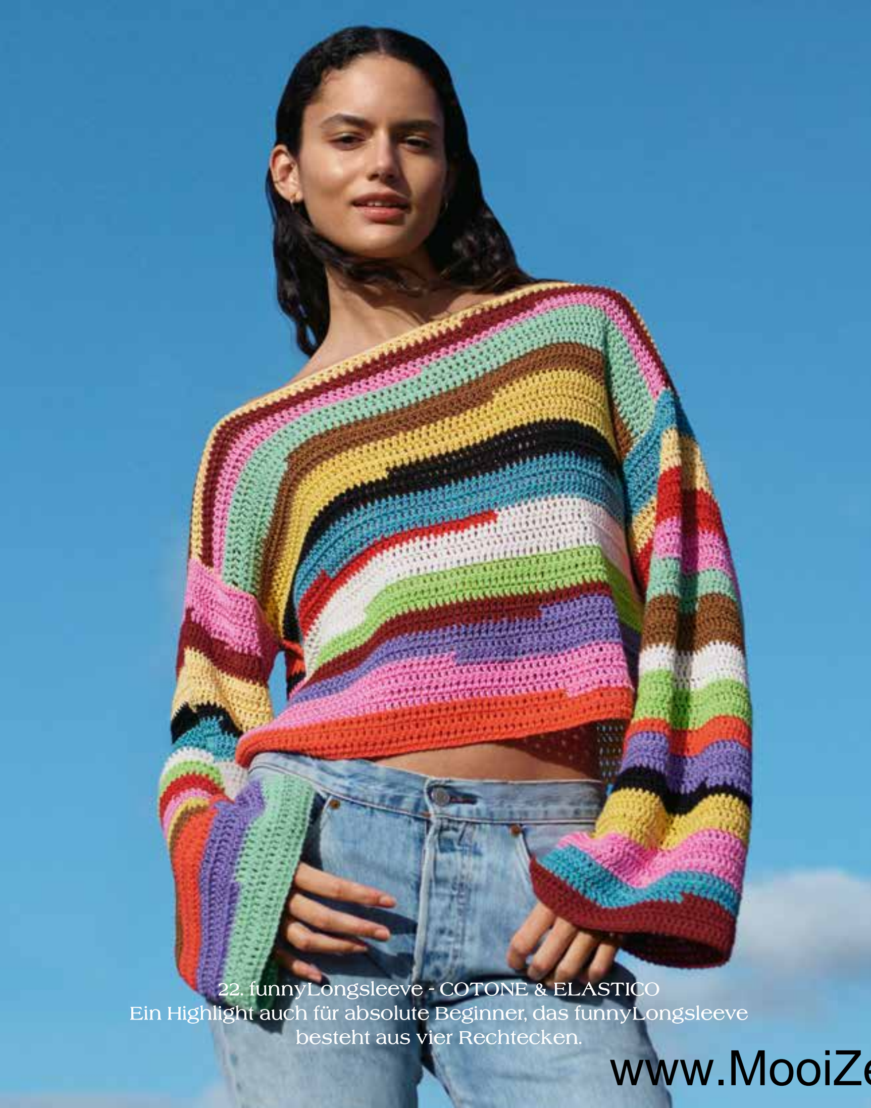
22. funnyLongsleeve - COTONE & ELASTICO Ein Highlight auch für absolute Beginner, das funnyLongsleeve besteht aus vier Rechtecken.