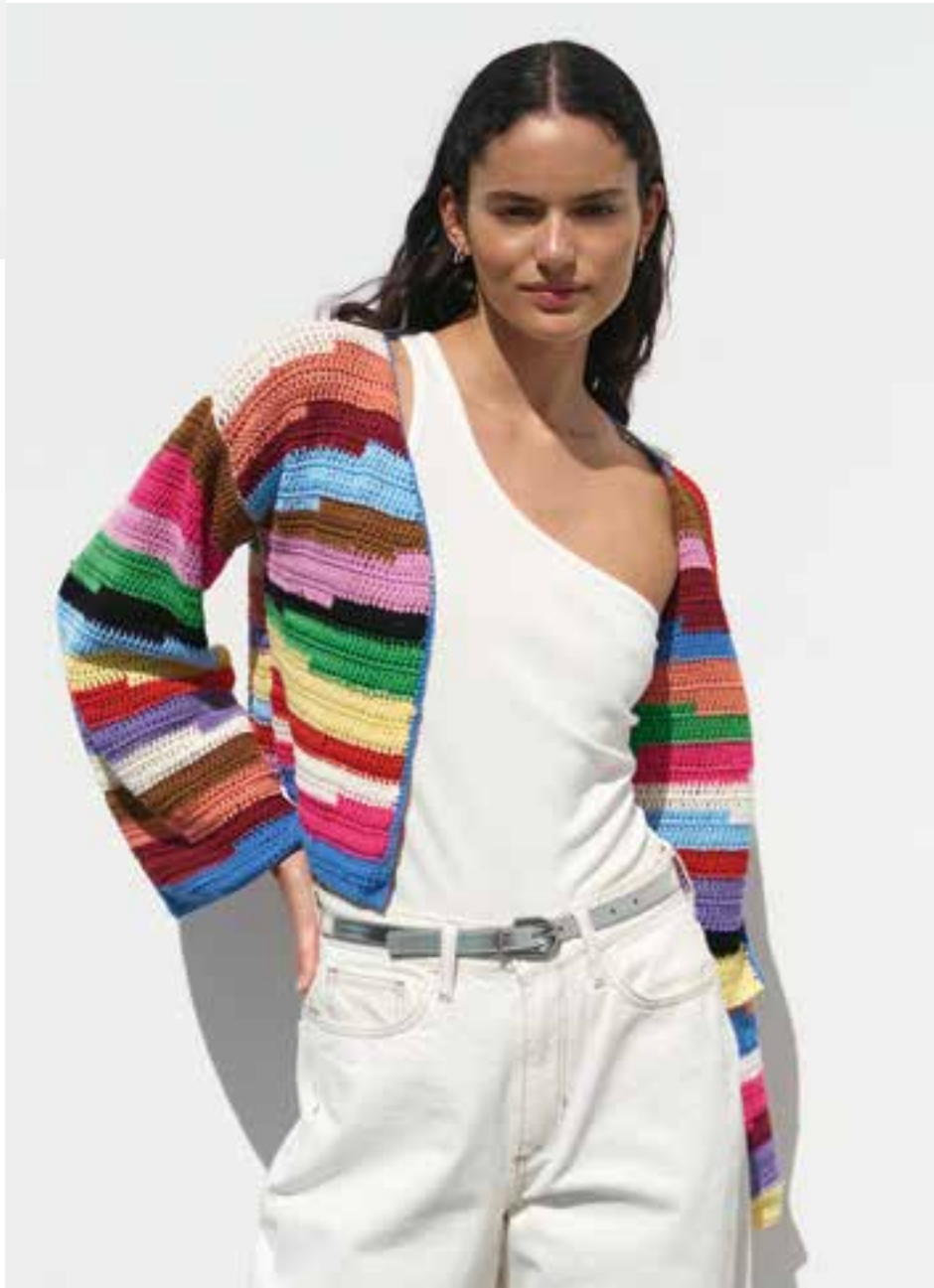
21. funnyCardigan - COTONE & ELASTICO