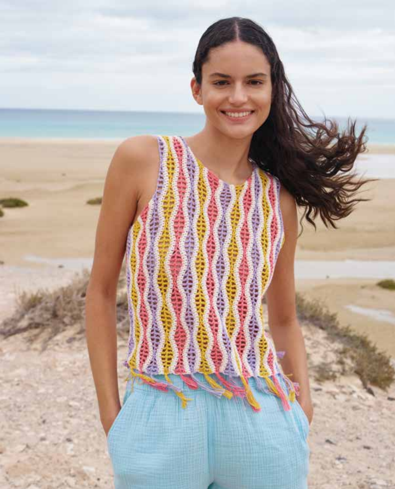
28 · Quergehäkeltes Top in mehrfarbigem Wellenmuster mit nachträglich eingeknüpften Fransen – CAMPO .