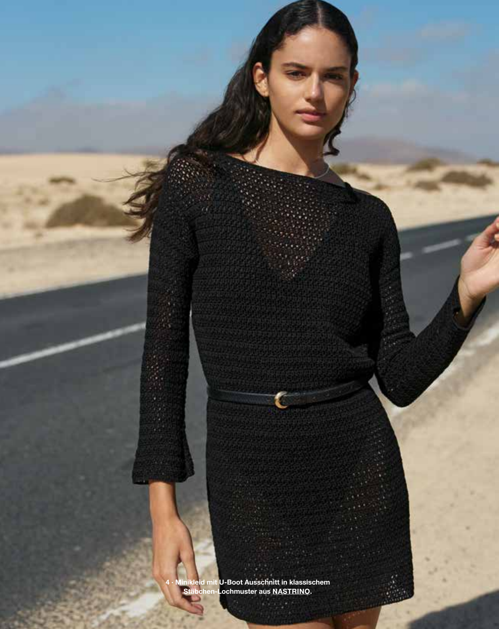
4 • Minikleid mit U-Boot Ausschnitt in klassischem Stäbchen-Lochmuster aus NASTRINO .