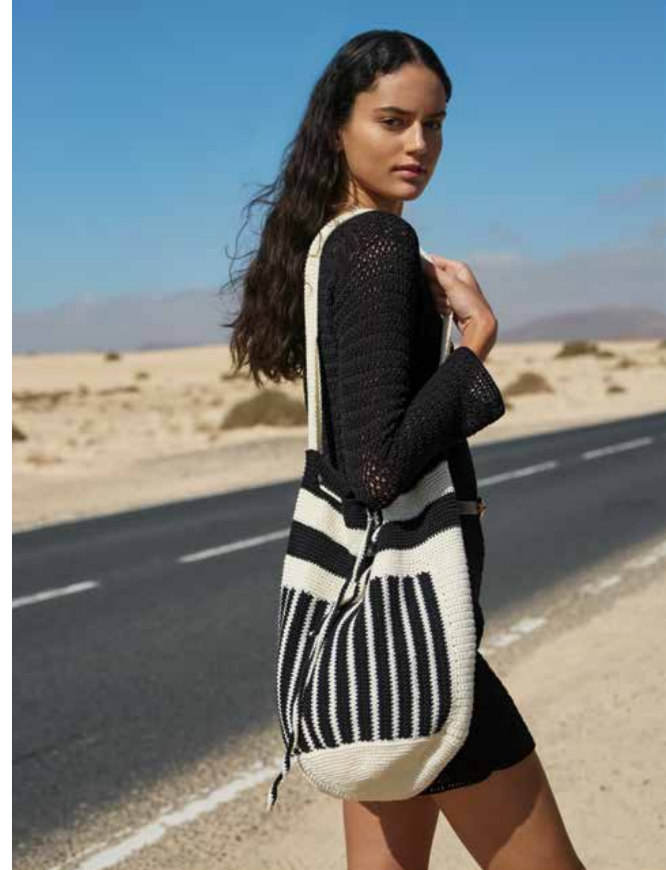
5 • Stabile Beuteltasche mit grafischem Muster und Tunnelzug aus COTONE .