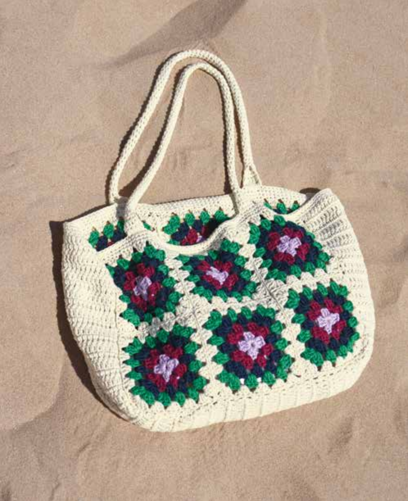
16 · Ein perfekter Begleiter – der Granny-Shopper aus ORGANICO .