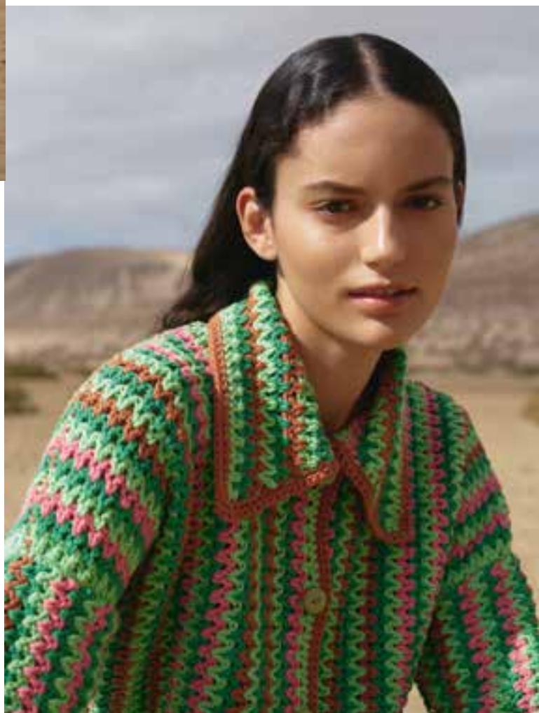
34 · Schicke Hemdjace, quergehäkelt und mit Abschluss in Kontrastfarbe – ORGANICO .