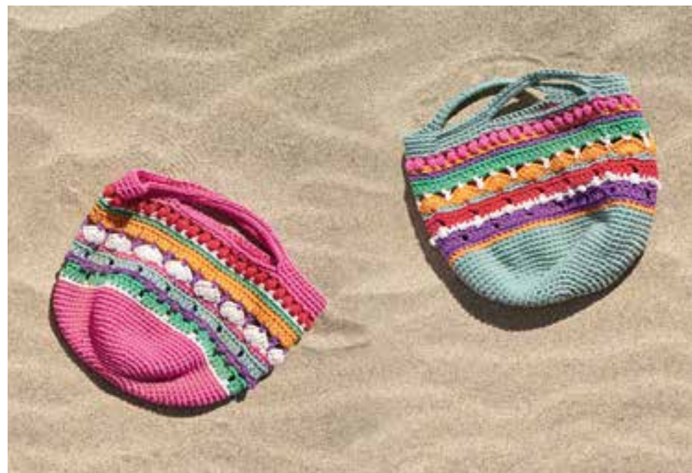
14 · Korbtaschen im Mustermix aus PROMESSA .