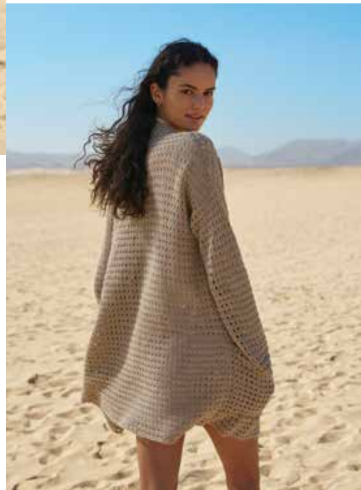
12 · Klassischer hüftlanger Cardigan mit Stäbchen-Mix aus LINISSIMO .