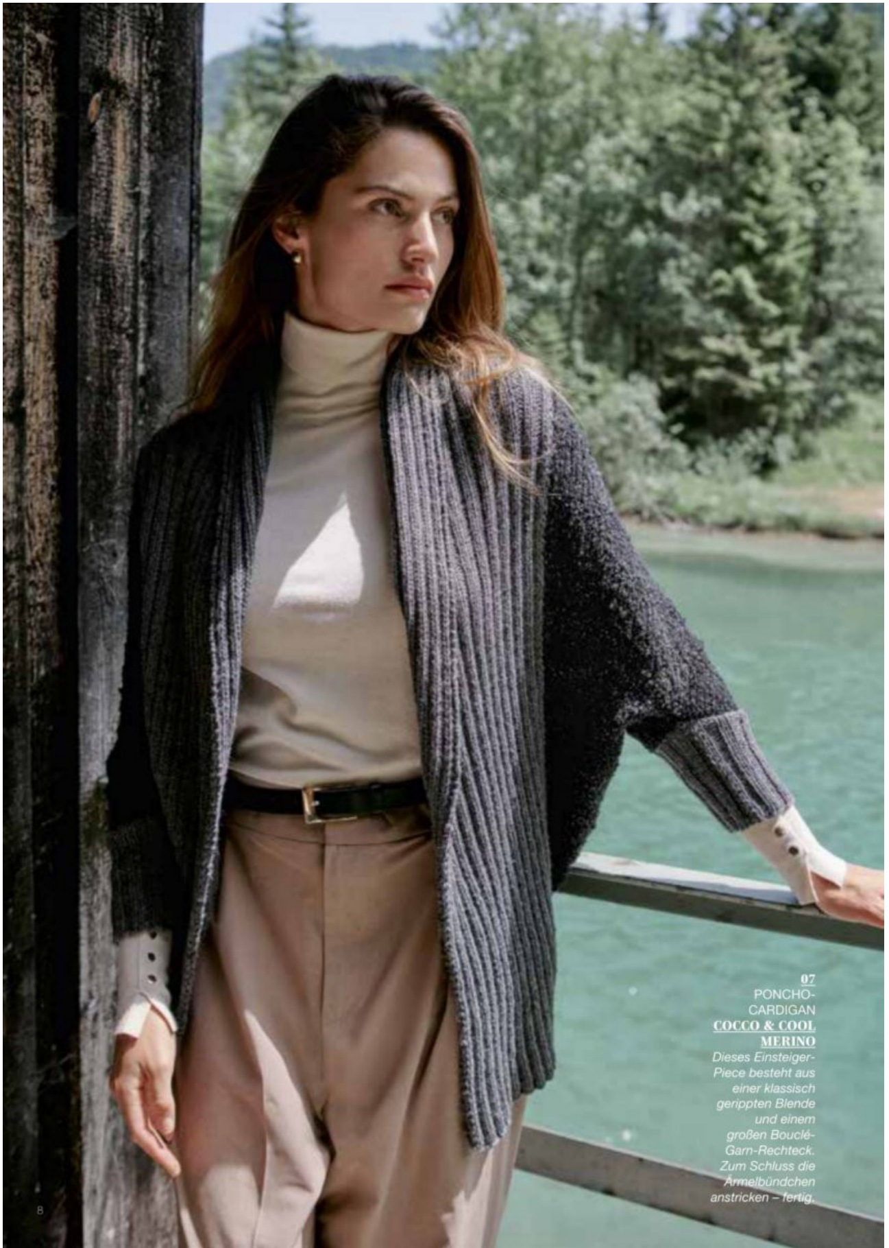
07 PONCHO- CARDIGAN COCCO & COOL MERINO Dieses Einsteiger- Piece besteht aus einer klassisch gerippten Blende und einem großen Bouclé- Garn-Rechteck. Zum Schluss die Ärmelbündchen anstricken – fertig.