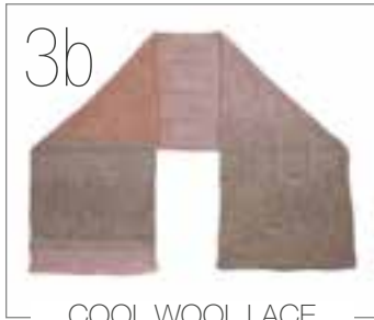
COOL WOOL LACE HAND-DYED & SILKHAIR