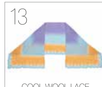
COOL WOOL LACE HAND-DYED