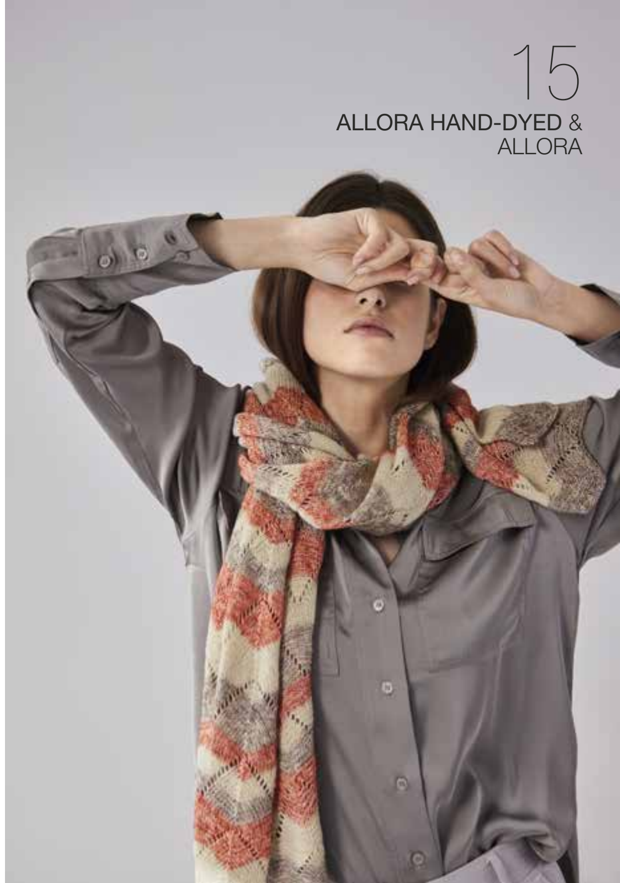
15 ALLORA HAND-DYED & ALLORA