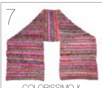
COLORISSIMO & SILKHAIR