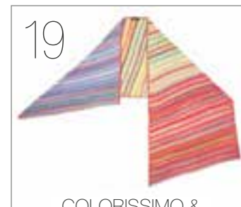
COLORISSIMO & ALLORA