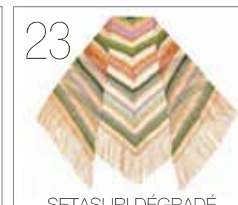
SETASURI DÉGRADÉ & MARE