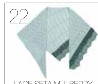
LACE SETA MULBERRY