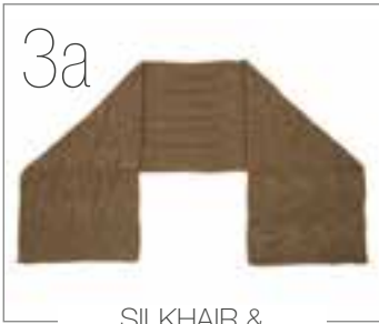
SILKHAIR & COOL WOOL LACE