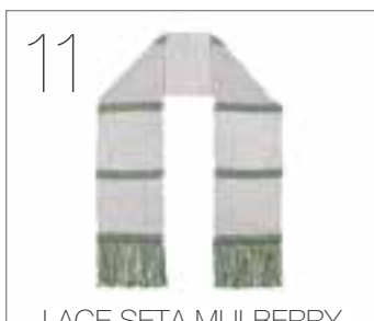
LACE SETA MULBERRY