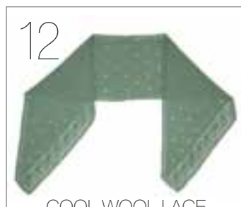
COOL WOOL LACE