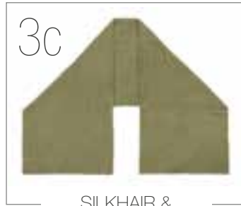
SILKHAIR & COOL WOOL LACE