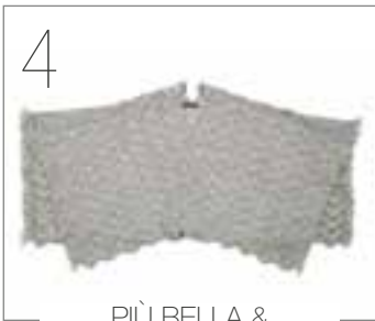
PIÙ BELLA & LACE SETA MULBERRY