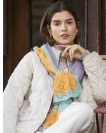
13 COOL WOOL LACE HAND-DYED