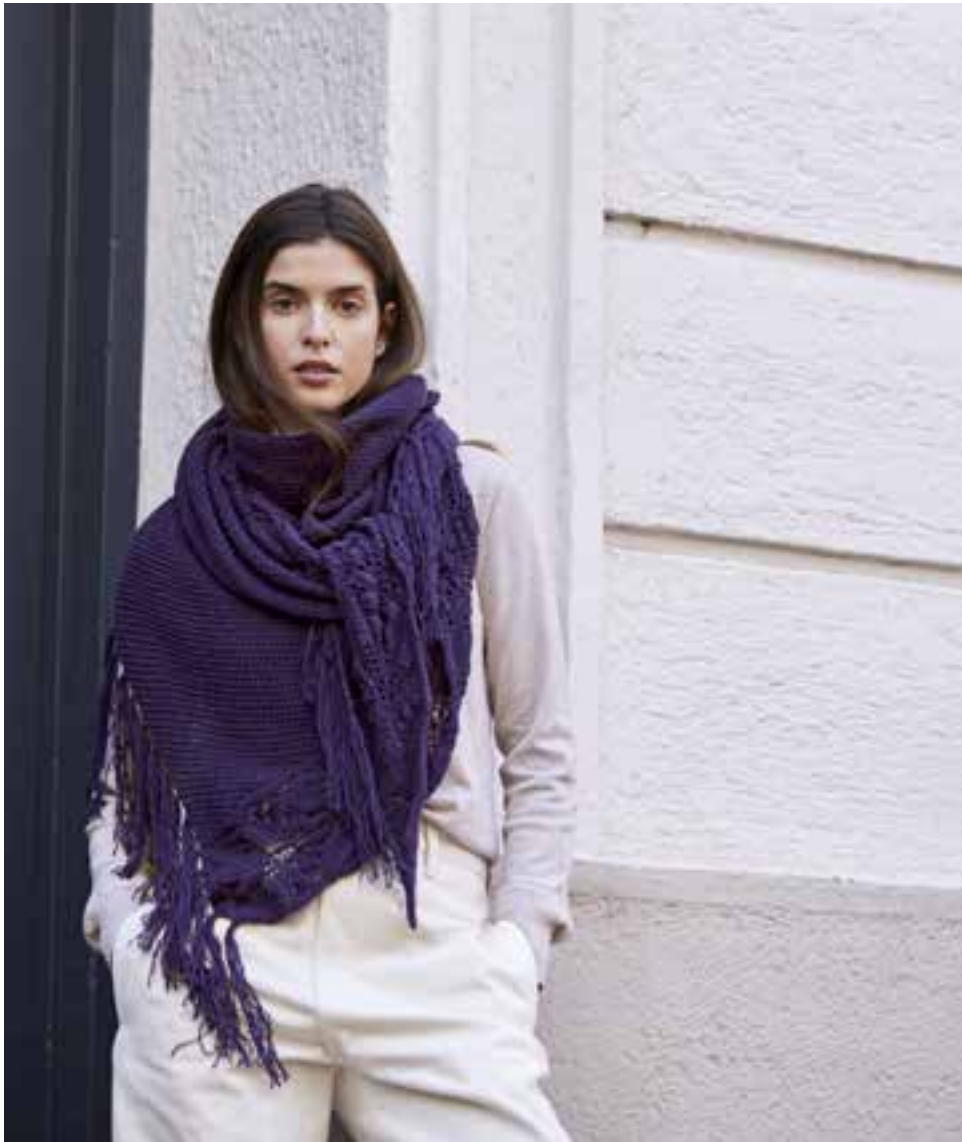
14b CASHMERE LOVE