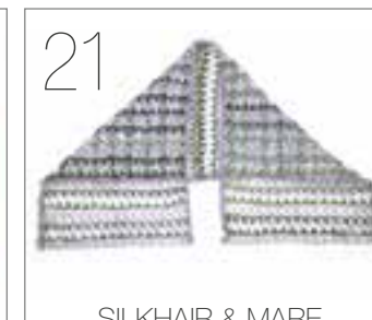
SILKHAIR & MARE