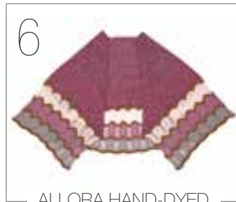
ALLORA HAND-DYED & ALLORA