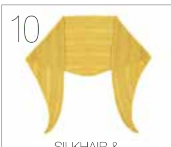
SILKHAIR & CASHMERE LOVE