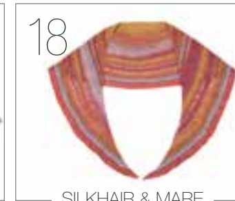
SILKHAIR & MARE