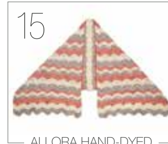
ALLORA HAND-DYED & ALLORA