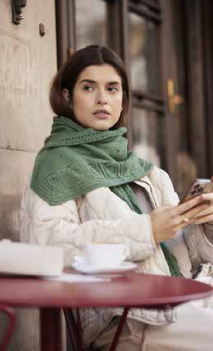
12 COOL WOOL LACE