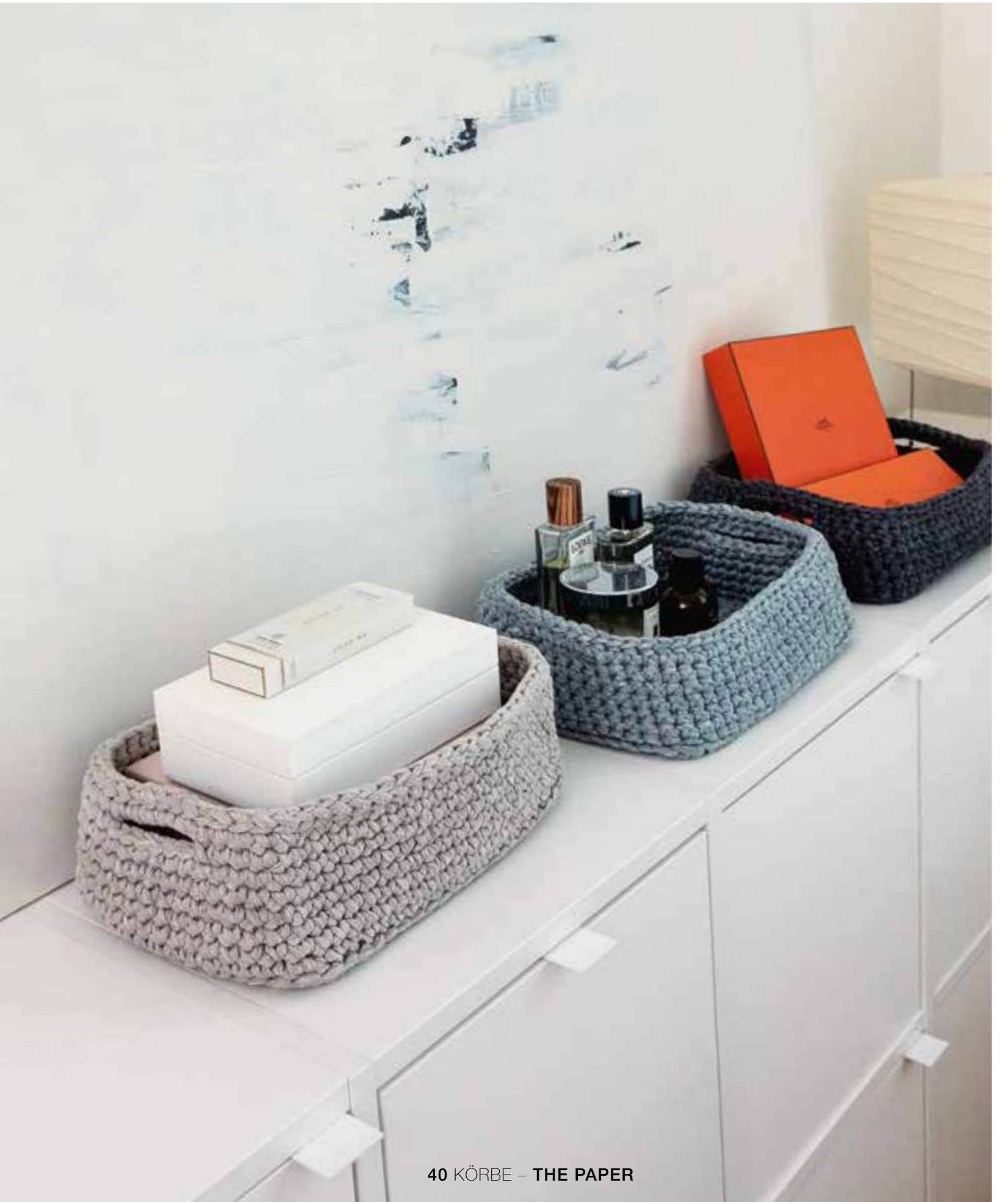
40 KÖRBE – THE PAPER