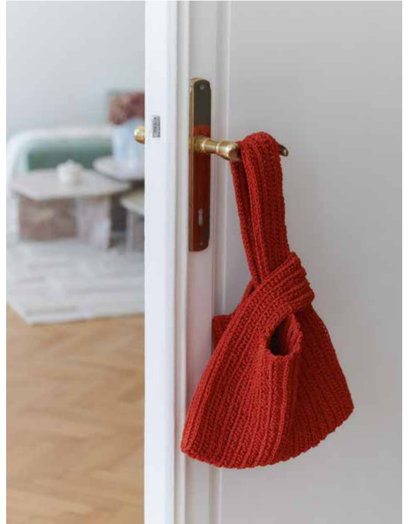
38 PULLOVER – SPUMA | 39 HÄKELTASCHE – THE CORE