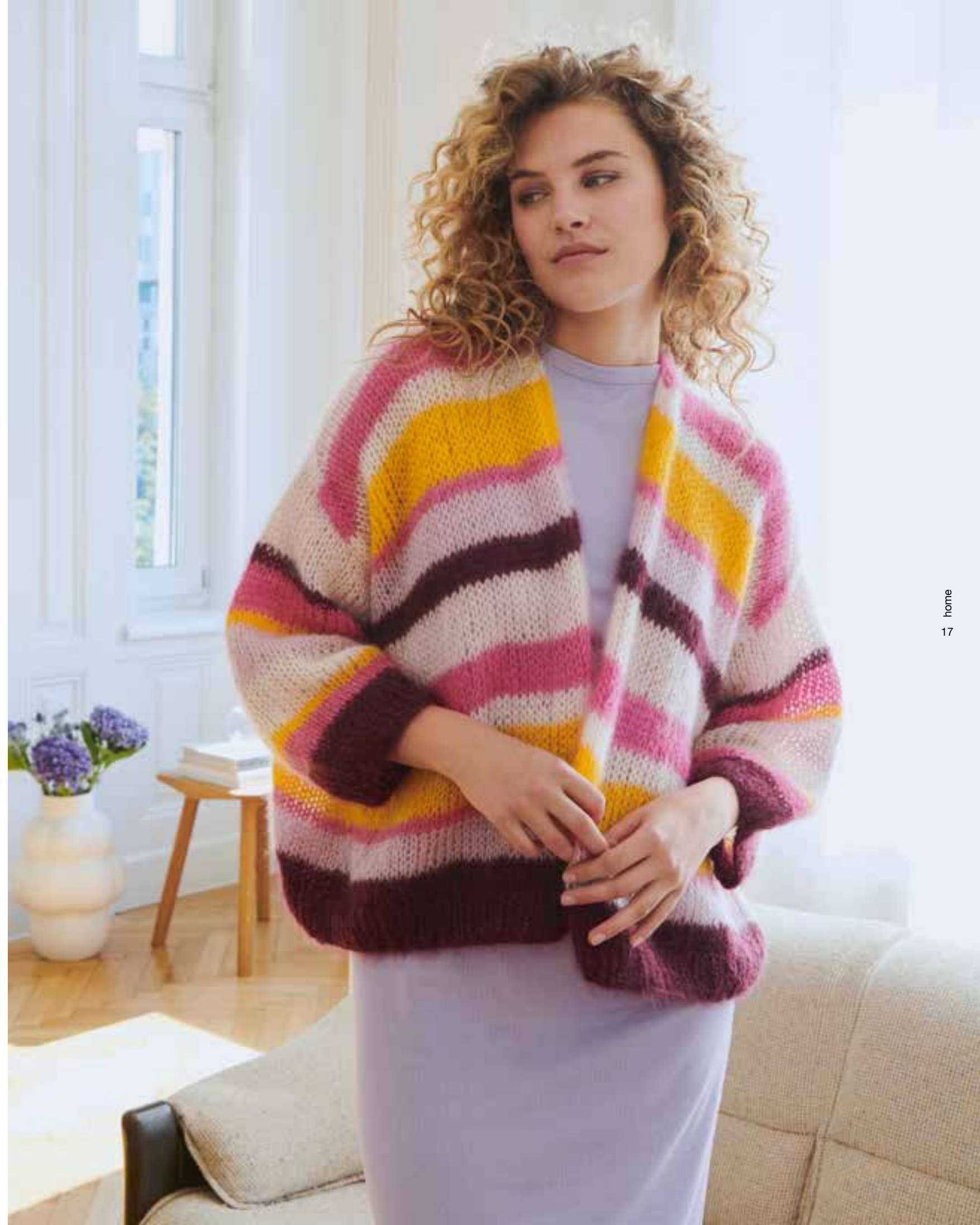
16 UTENSILO – THE TUBE | 17 CARDIGAN – SILKHAIR