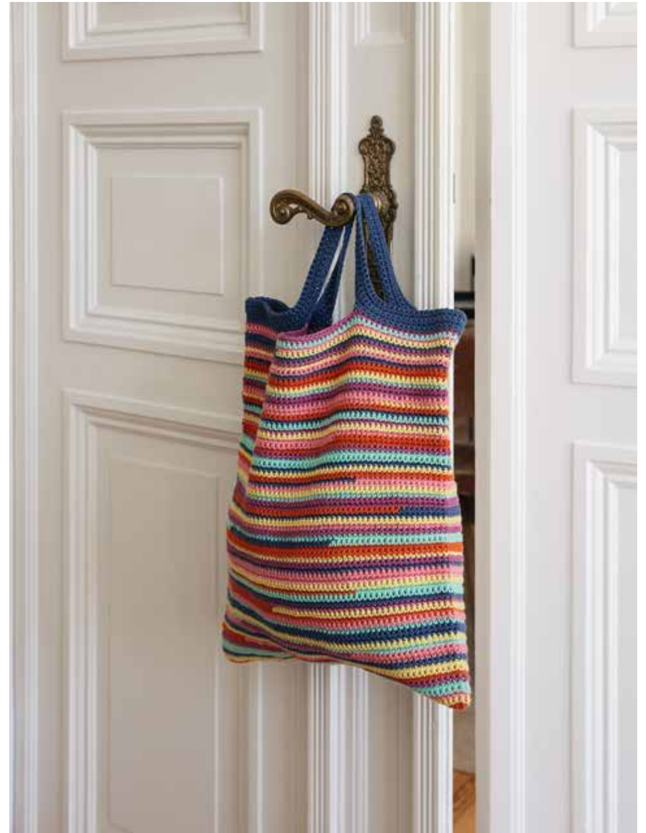
18 + 19 DECKE, NACKENROLLE – ALPACA AIR | 20 SHOPPER – ORGANICO