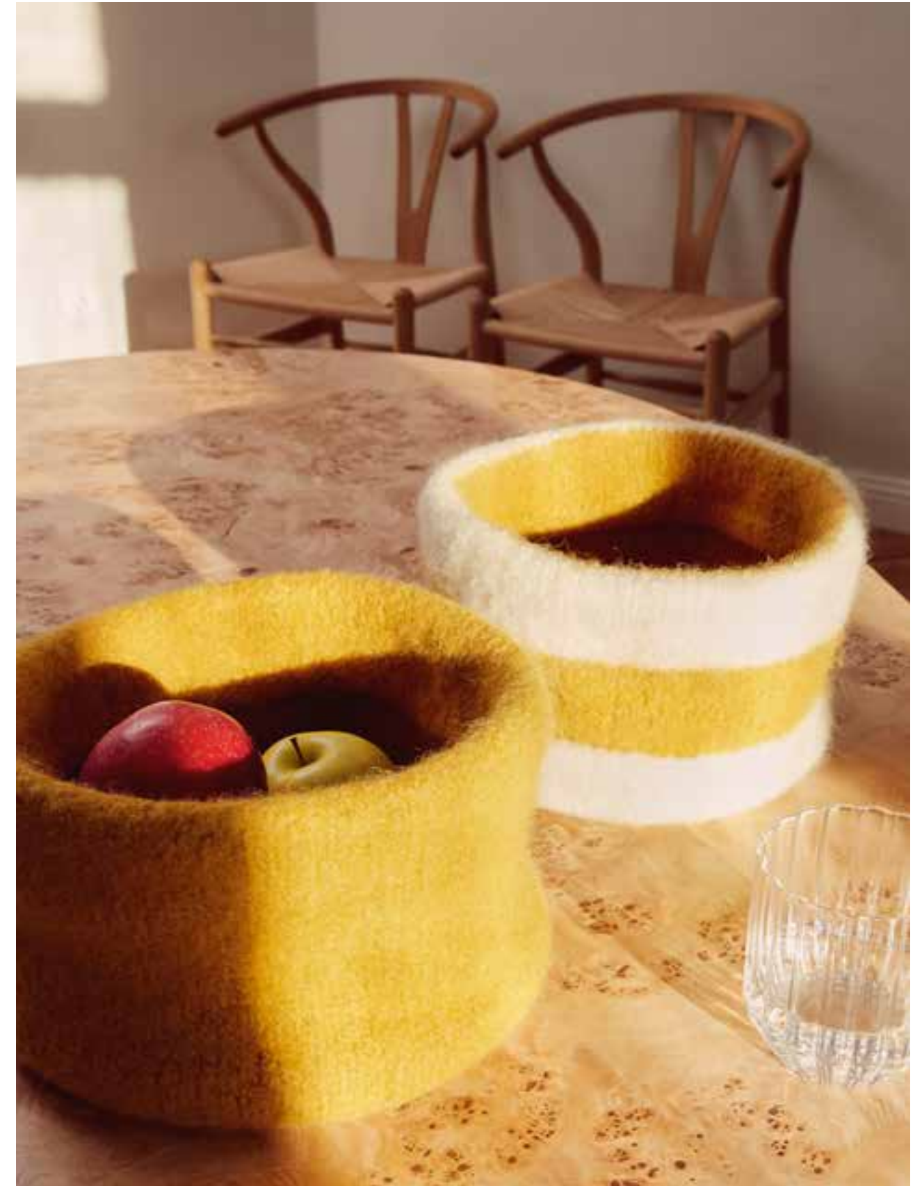
28 WANDSCHMUCK – THE TUBE | 29 KÖRBE – FELTRO