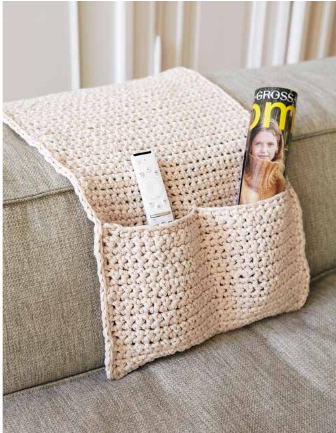
35 UTENSILO – THE PAPER | rechts: 36 + 37 DECKE, KISSEN – NEU: MERINO TWISTER NACKENROLLE – NEU: WOOHOO (07, Seite 10/11)