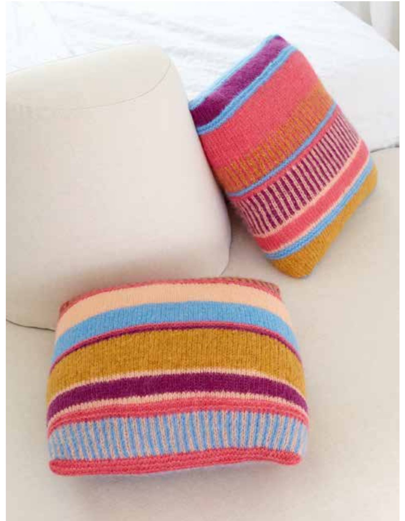
13 DECKE – LALA BERLIN FLAMY + SILKHAIR | 14 + 15 KISSEN – ALPACA AIR