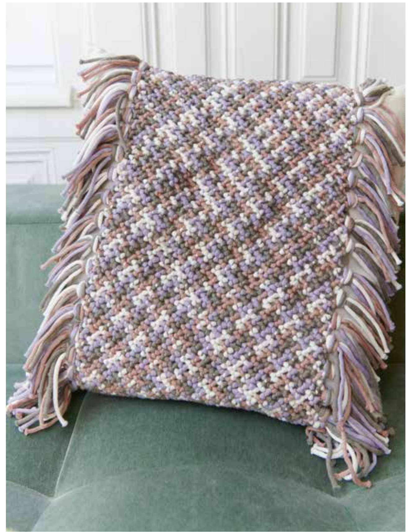
43 HÄKELDECKE – ALTA MODA ALPACA | 44 KISSENHÜLLE – THE TUBE