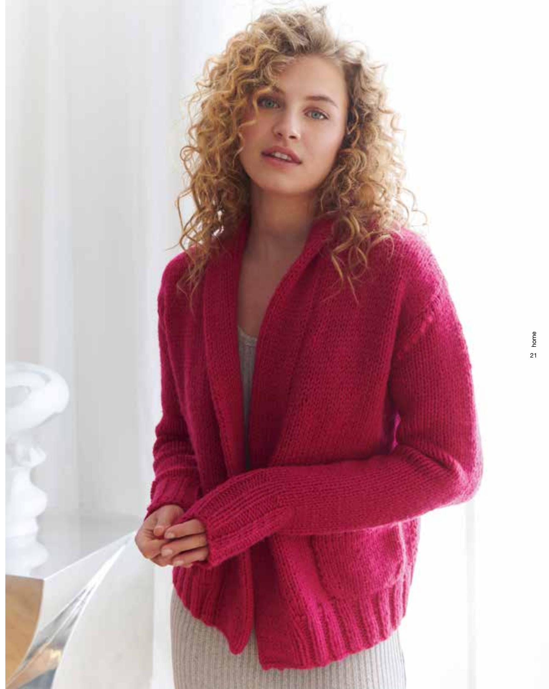
21 ZUGLUFTSTOPPER – MILLE II | 22 CARDIGAN – BRIGITTE NO. 5