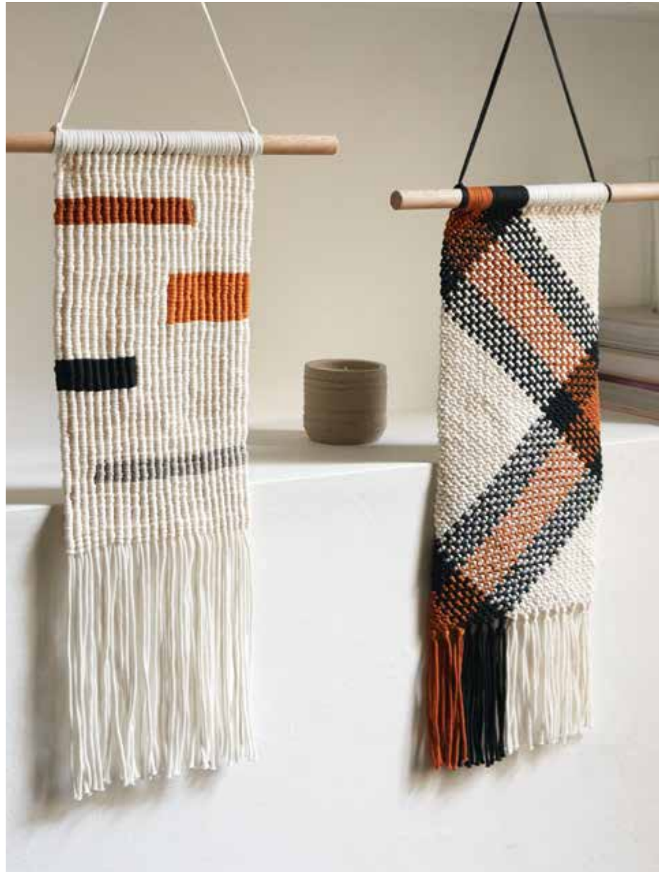
47 + 48 WANDSCHMUCK – THE TUBE FINE | 49 HOCKERBEZUG – THE TUBE DECKE – ECOPUNO CHUNKY + COOL MERINO BIG (09, SEITE 10/11)