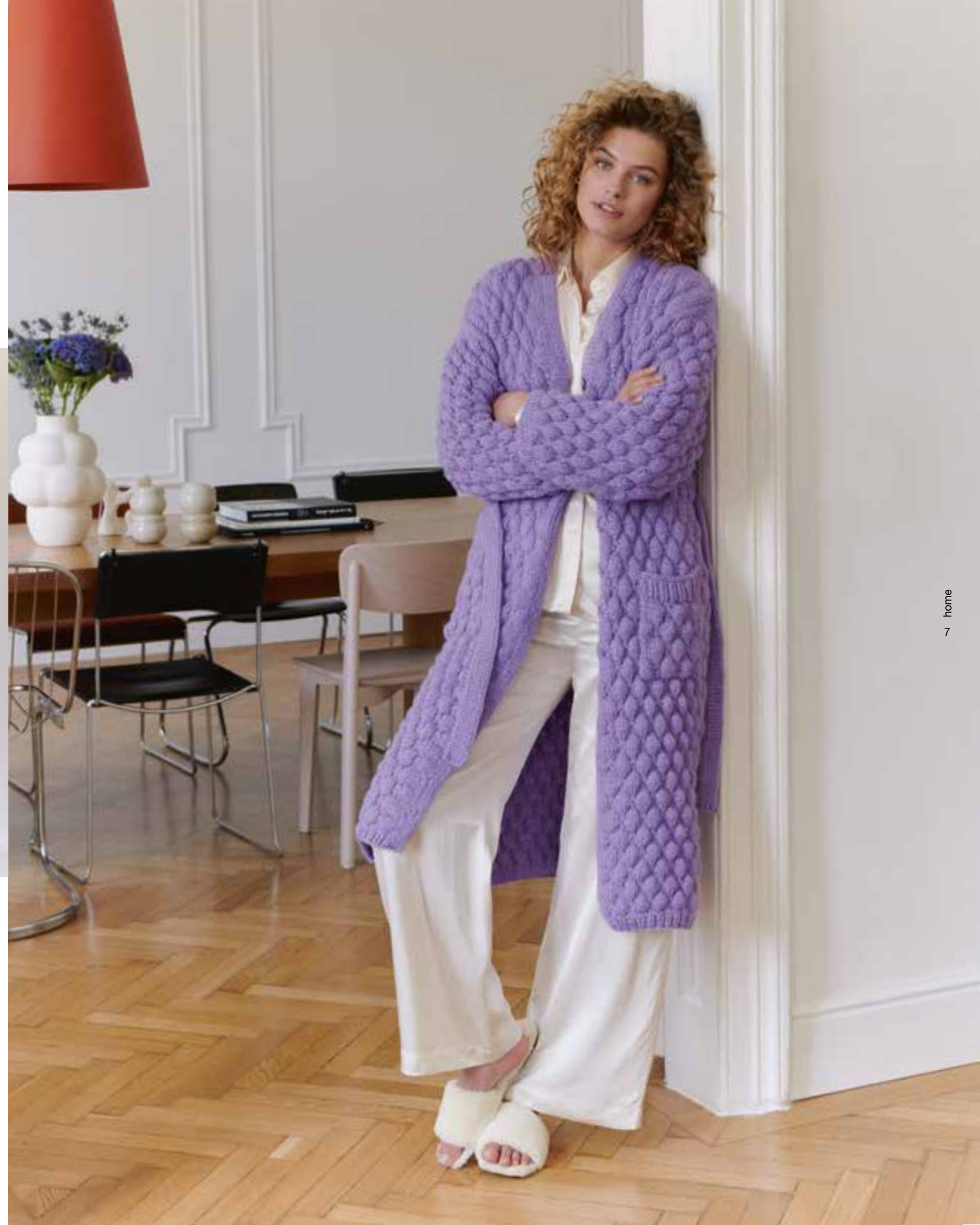
02 KISSEN – BRIGITTE NO. 2 03 MANTEL – SPUMA