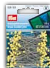
Glaskospelden, geel, 20 g Bestelnr. 029 153