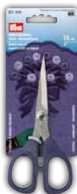
Borduur-/Knutselschaar, 13 cm = 5" Bestelnr. 611 510