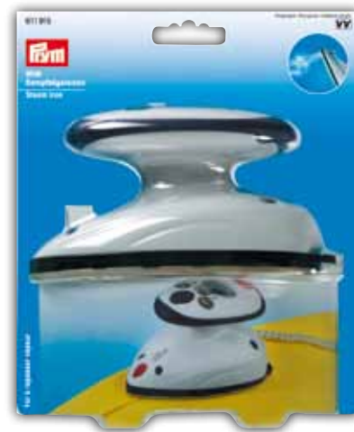
Persstrijkijzer Mini Bestelnr. 611 915 Bestelnr. 611 916 (voor UK)